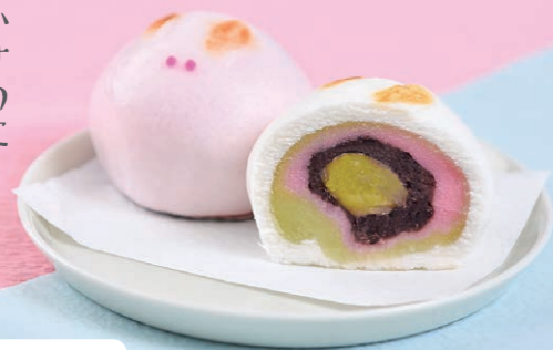
彦九郎まんじゅう 600円