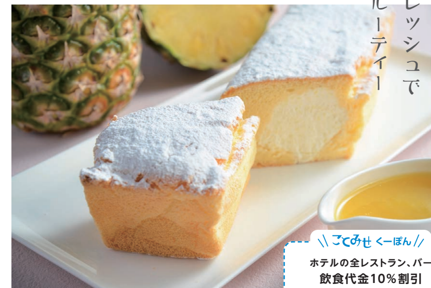
生パウンドケーキ・パイナップル台湾カステラ(21cm) 1,750円