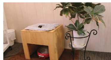
エレベーターを降りると広がるニューヨーク風空間。よもぎ蒸しも人気。子連れOK!