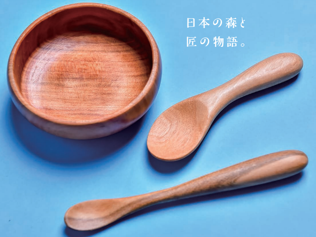
離乳食スプーンと小皿のセット6,000円