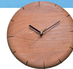
新潟県糸魚川市産のブナの木で作った ブナの時計19,500円