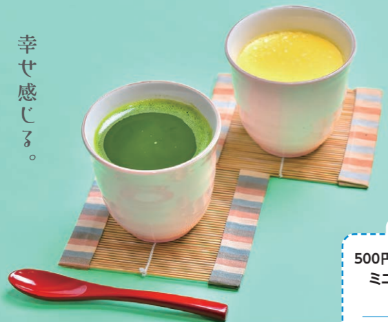
自家製カスタードプリン 430円 濃い抹茶ソース付き 490円