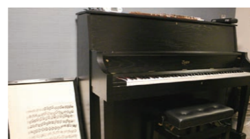
ピアノ・ヴァイオリン・クラシックギタークラスも開講。体験レッスン随時受付中