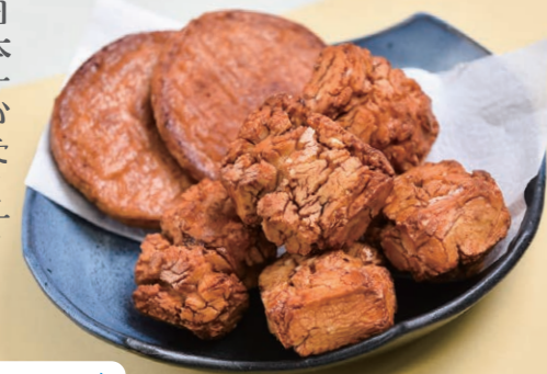
日本一堅いげんこつ・古武士 690円 日本一硬いせんべい・極堅深川 690円