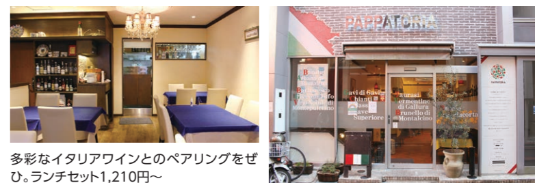
多彩なイタリアワインとのペアリングをぜひ。ランチセット1,210円~