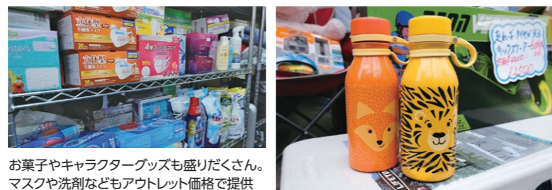
お菓子やキャラクターグッズも盛りだくさん。マスクや洗剤などもアウトレット価格で提供